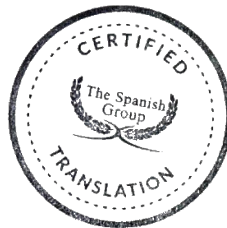
Salvador G. Ordorica The Spanish Group LLC (ATA #267262)

The Spanish Group LLC verifies the credentials and/or competency of its translators and the present certification, as well as any attached pages, serves to affirm that the document(s) enumerated above has/have been translated as accurately as possible from its/their original(s). The Spanish Group LLC does not attest that the original document(s) is/are accurate, legitimate, or has/have not been falsified. Through having accepted the terms and conditions set forth in order to contract The Spanish Group LLC's services, and/or through presenting this certificate, the client releases, waives, discharges and relinquishes the right to present any legal claim(s) against The Spanish Group LLC. Consequently, The Spanish Group LLC cannot be held liable for any loss or damage suffered by the Client(s) or any other party either during, after, or arising from the use of The Spanish Group LLC's services.